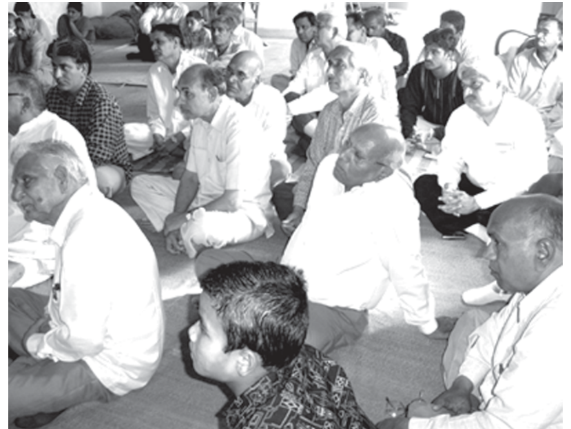
-पूज्य गुरुदेव के प्रभावशाली प्रवचन को ध्यानपूर्वक सुनते हुए हिसार के भक्तगण।