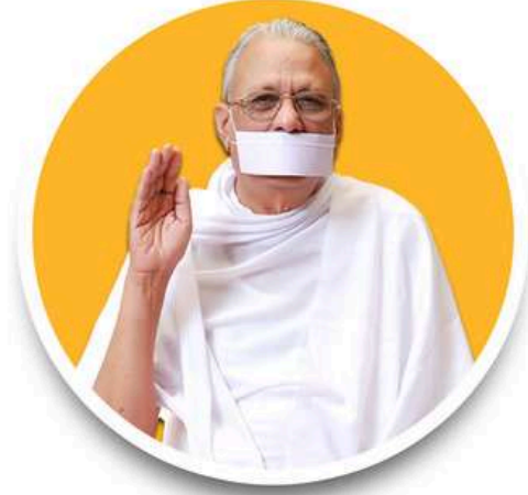
Founder Trustee and Chairman