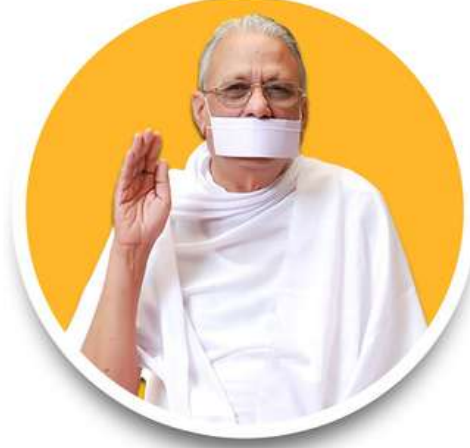
Founder Trustee and Chairman